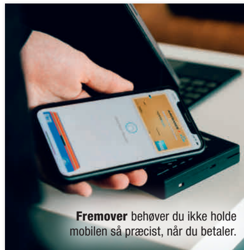
Fremover behøver du ikke holde mobilen så præcist, når du betaler.

≡ I dag er trådløs betaling med kort og mobil blevet standard, men det kan stadig være bøvlet at få mobilen eller kortet og betalingsterminalen til at "fange" hinanden, så betalingen kan gå igennem. Det bliver snart nemmere: De næste måneder bliver en opdateret udgave af NFC-teknologien nemlig rullet ud, og en af de største forbedringer er, at afstanden nu øges mellem betalingskort og terminal. Med den nuværende NFC-teknologi skal mobilen eller kortet holdes 0,5 centimeter fra terminalen, mens det med den nye NFC 15-teknologi bliver muligt at betale 2,5 centimeter fra. Det forventes, at de første enheder med NFC 15 kommer på markedet i slutningen af 2025 eller starten af 2026.