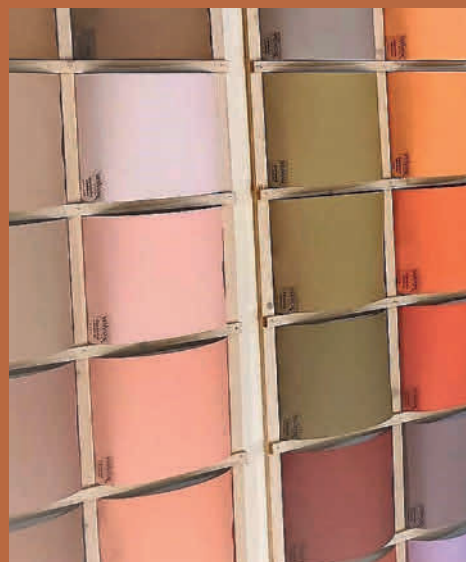
Savimaali on diffuusioavointa, ja väri vaihtoehtoja on paljon.