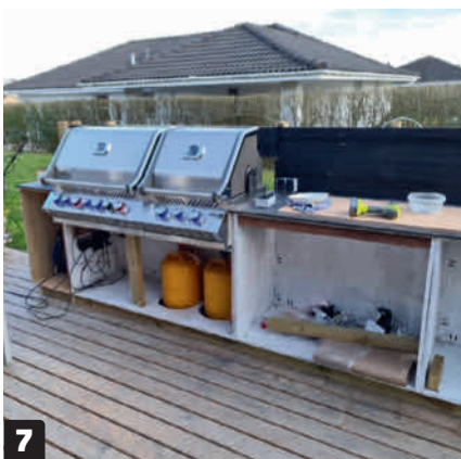
7 Kaasupullot pitää säilyttää avoimessa paikassa. Rimat antavat ilman liikkuu. Kaasu on raskasta, joten vuodon sattuessa kaasu painuu alas.