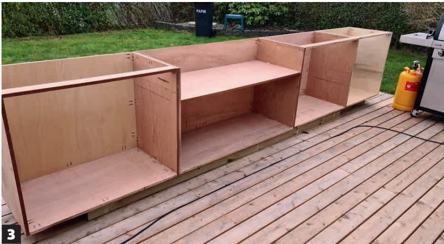
3 Elementit yhdistetään toisiinsa ruuveilla. Alakaapit asennetaan vierekkäin sokkelin päälle ja ruuvataan yhteen sekä terassiin ruostumattomilla ruuveilla.