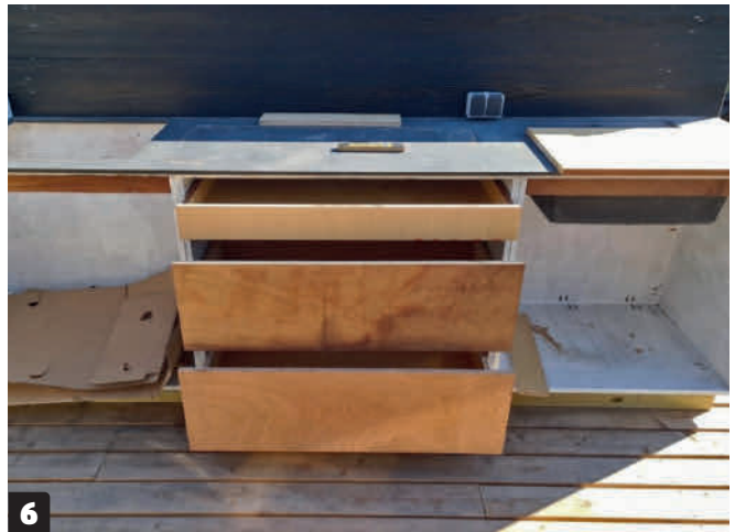
6 Tuulensuojalevyt ja laatikot. Altaan vasemmalle puolelle on asennettu kolme itse tehtyä laatikkoa, joissa on hyvin säilytystilaa. Lisäksi pöydän taakse on tehty tuulelta suojaava seinämä mustista laudoista.