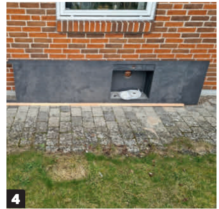
4 Halpa ja käytetty pöytälevy. Kesäkeittiön omistaja sattui saamaan käsiinsä käytetyn komposiittipöytälevyn, jossa on upotettu allas. Se kestää säätä kohtuullisen hyvin.