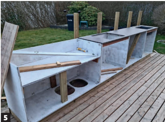
5 Elementit on maalattu ja grillipöydän alle on asennettu pystytuuet. Myös elementtien taakse on asennettu rakennetta tukevat pystylankut.