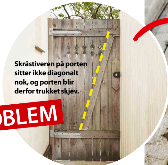
Skråstiveren på porten sitter ikke diagonalt nok, og porten blir derfor trukket skjev.

PRIS: Ca 30 kroner til et bord og noen rustfrie skruer.