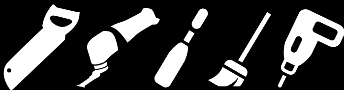
VANERISAHA MULTICUTTERI TALTTA PENNELI RUUVINVÄÄNNIN

Lahonneen puun poistamiseen ja ikkunan korjaamiseen tarvitaan vain muutama tavallinen työkalu: