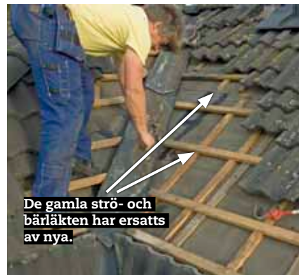
De gamla strö- och bärläkten har ersatts av nya.

3 Pensla alla skarvar och spikar med takkitt. Kitt kladdar enormt så du ska använda oömma kläder eller vara beredd att slänga dem efteråt. Lägg ev. självhäftande papp ovanpå.