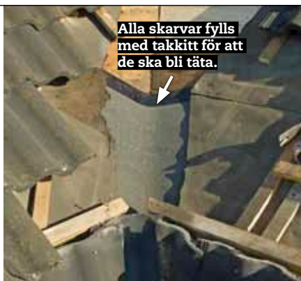
Alla skarvar fylls med takkitt för att de ska bli täta.

” Det går bra med en fogsvans när du sågar hål i underlagstaket, men det går snabbare och är enklare med en multicutter.