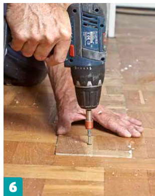
6 Ruuvaa lauta kiinni jokaiseen tukipuuhun 40–50 millillä pitkällä ruuvilla. Poraa lautoihin reiät ruuvinkantojen upottamista varten.