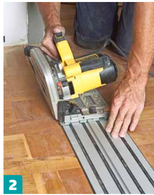
2 Sahaa reiän reunat suoriksi joko upotus- tai pistosahalla. Käytä apuna ohjainkiskoja tai suoraa lautaa. Käännä terä noin 10 astetta vinoon siten, että reikä on levein lattian pinnassa.