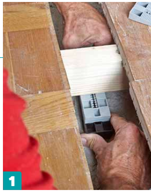
1 Aseta paikkauslaudan alle uudet tukipuut 40 sentin välein, ja kiilaa ne lujasti lattian alapintaa vasten. Ruuvaa kiilat kiinni toisiinsa ja lattiaan. Sivele liimaa tukipuiden ja lattian väliin.

Tässä lattiassa parketin kuvio menee väistämättä rikki. Paikattu kohta ei kuitenkaan hyppää silmille valmiista lattiasta.