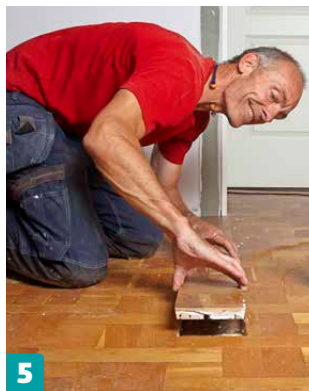
5 Sivele laudan reunoihin liimaa ja paina lauta reikään. Upota laudan pinta samaan tasoon muun lattian kanssa.