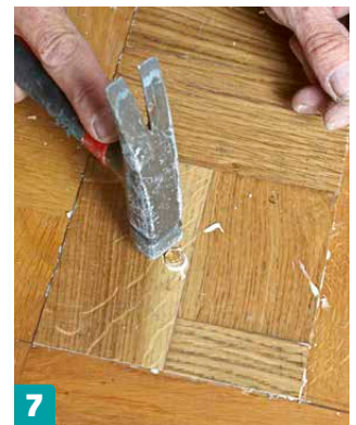
7 Piilota ruuvinkanta puutulpan alle. Liimaa tulppa kiinni lattiaan ja pyyhi ylimääräiset liimat pois.