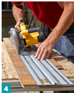
4 Tee lauta, joka sopii reikään millintarkasti. Sahaa reunat vinoon kulmaan samaan tapaan kuin vanhassa lattiassa.