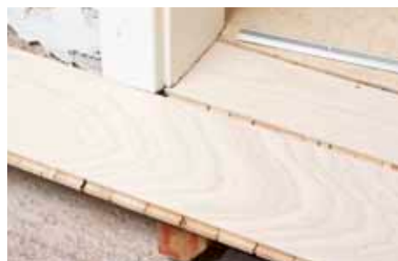
Den bakre kanten av den första raden kilas mot väggen så att nästa rad kan knäckas fast.

4 Brädan i öppningen ska vara så bred att den går in under karmen. Skjut in den på plats och skruva fast den. Nu ska den yttre kanten mot rummet ligga i rak linje med den första genomgående raden.