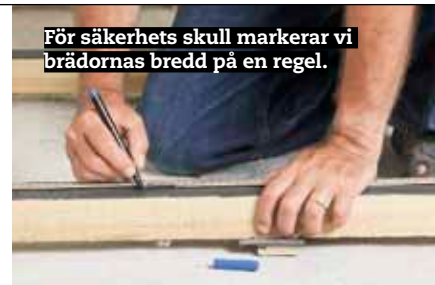
För säkerhets skull markerar vi brädornas bredd på en regel.

1 Vi tynger ner reglarna, så att vi av misstag inte rubbar dem när vi går mellan dem. Det enklaste är att lägga ett par paket golvbrädor i ett par förskjutna rader tvärs över reglarna.