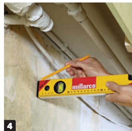
4 Förbered för läkt (C) på väggen. Håll ett vattenpass in mot insidan på framsidan. Markera höjden på väggen. Sätt läkten på väggen med skruv och plugg på den höjd som du har markerat.