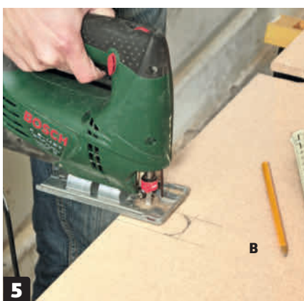
5 Såga ut för lodräta rör. Håll upp undersidan (B) och markera var du behöver såga ut för lodräta rör. Såga med en sticksåg.