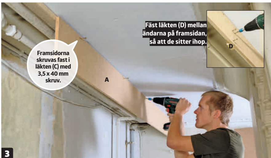
3 Skruva fast framsidor (A) i läkten under taket. Använd 3,5 x 40 mm skruv för att fästa framsidorerna. Använd läkten (D) för att sätta ihop framsidorerna.