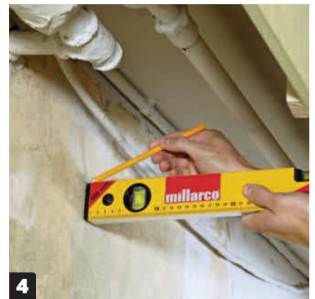
4 Klargjør til lekter (C) på veggen. Hold et vater mot bunnen av frontplatene. Marker høyden på veggen. Sett fast lekten på veggen med plugg og skruer i den høyden du har avsatt.