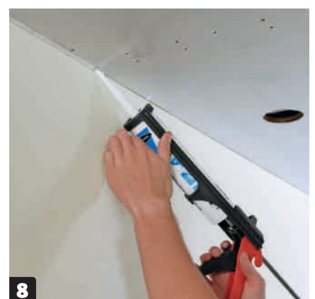
8 Deretter fuger du. Legg en fugemasse der kassen møter veggen og taket. Bruk akrylfugemasse. Den kan males over når du legger på de siste malingsstrøkene.