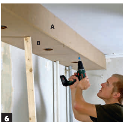
6 Skrus på bunnplatene (B). Løft dem på plass, og støtt dem midlertidig på midten med en lekt, som settes i spenn på gulvet. Skru deretter fast bunnplatene med 3,5 x 40 mm skruer.