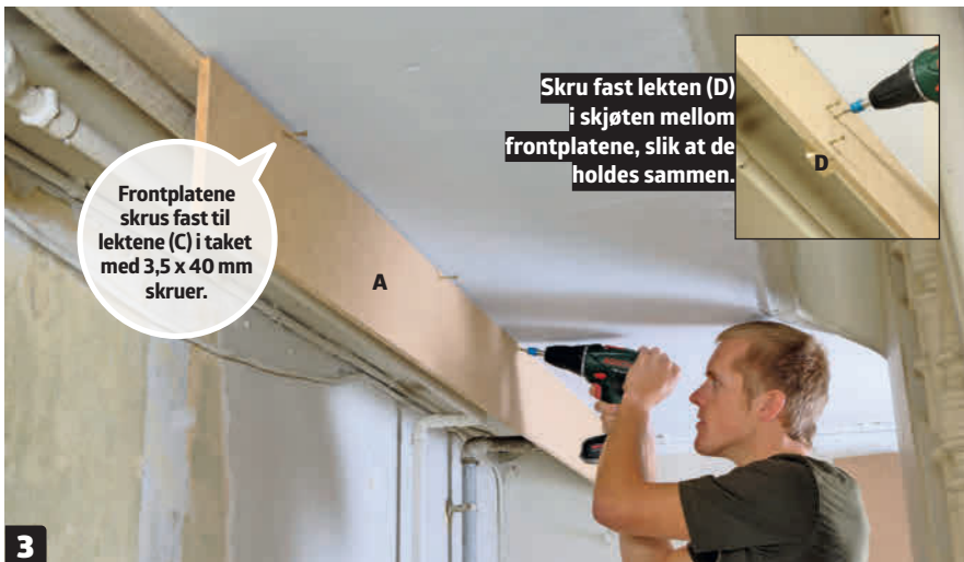
3 Skrus fast frontplater (A) til lektene i taket. Bruk 3,5 x 40 mm skruer. Bruk den korte lektebiten (D) til å skru sammen frontplatene i endeskjøtene.