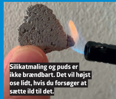
Silikatmaling og puds er ikke brændbart. Det vil højst ose lidt, hvis du forsøger at sætte ild til det.