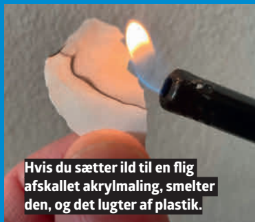
Hvis du sætter ild til en flig afskallet akrylmaling, smelter den, og det lugter af plastik.

Hvis væggen på forhånd er malet med en akrylmaling (plastmaling), kan du IKKE male over med silikatmaling; det vil blot skalle af. Akrylmalingen skal renses helt væk, og det er desværre et større arbejde med stålbørste og slibemaskiner. Men måske er du heldig, at der er malet med silikatmaling eller kalkmaling.