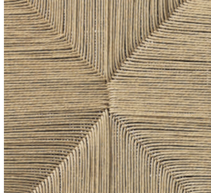
Stjerne- eller kuvertmønster

Du bestemmer egentlig selv felternes størrelse, men ved et ternet mønster skal du regne ud, hvor store felterne skal være. Det gør du ved at dele sargens længde med garnet eller snorens tykkelse (her 4 mm). Husk at beregne luft mellem felterne, så der bliver plads til at flette den tværgående side. I vores tilfælde er den bageste sarg kortest – den er 40 cm, hvilket giver i alt 100 omgange. Vi har derfor valgt seks felter med 15 om-