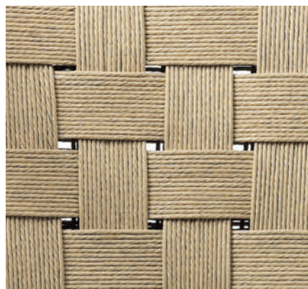
Ternet mønster med 15 surringer

gange (eller surringer) mellem sargene og fem luftfelter med to omgange (eller viklinger) mellem felterne. Flet ikke så tæt, at snorene ikke kan flettes pænt, hvor de krydser hinanden.