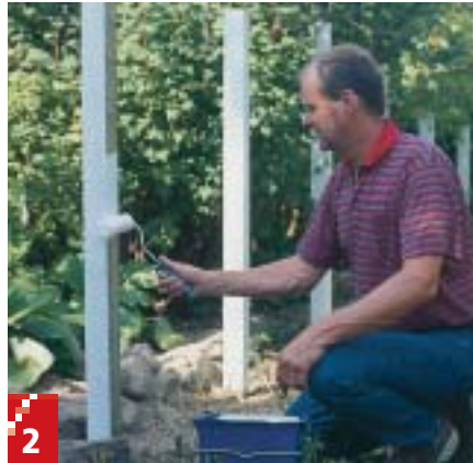
2 Stolperne males nemmest, efter de er gravet ned. Da de er trykimprægnerede, behøver de ikke behandling under jordoverfladen.