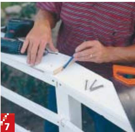
7 For at få helt præcise samlinger mellem overliggerne er det smart først at skære den ene til og skrue den fast med et par skruer for enden. Herefter løftes brættet op, og det andet bræt lægges på plads nedenunder. Så kan savsnittet tegnes af efter det første bræt.

Stolperne (B) graves 80 cm ned i jorden med et mellemrum på 110 cm. Tværlisterne (C) placeres for hver 20 cm. Den nederste tværstolpe skal være 5 cm fra jorden. Overkanten af indgange udgøres alene af en overligger (E).