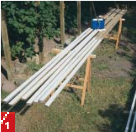
1 Mal alle lister, inden de skrues fast til stolperne. Brug evt. en langhåret rulle – så går det stærkt.